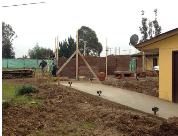
"REPOSICION LICEO PABLO NERUDA DE NAVIDAD"

Estado: Ejecución, avance de la obra 5%.