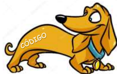
Imagen 4: Ejemplo de tatuaje