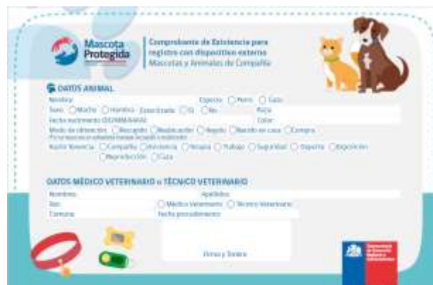
Imagen 2: Ficha existencia con dispositivo externo

Consiste en un código que puede ir tatuado en la mascota o escrito en la placa del collar, para esto debe inscribir a su mascota en la plataforma para obtener el código y luego asistir de manera particular a algún lugar para obtener la placa y grabarla como indica la imagen 3 o donde tatúen a su mascota como en la imagen 4 . Para realizar esta inscripción debe llenar la ficha de la imagen 2 , asistiendo a un veterinario o llevando a la municipalidad una foto digital de su mascota.