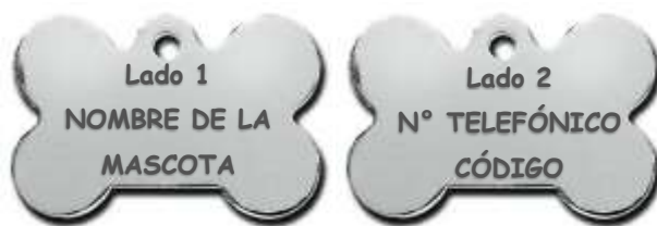
Imagen 3: Ejemplo de placa