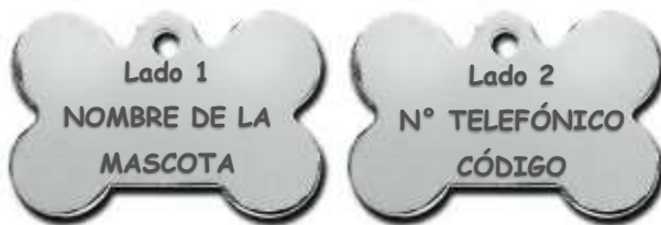
Imagen 3: Ejemplo de placa